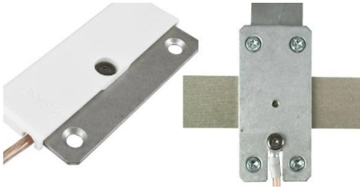
B – GS1 / GS2 / GS3 Grounding plate