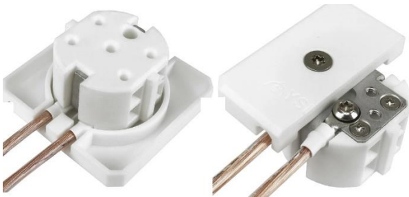
D- GP1 grounding plug

Contact / Ota yhteyttä Anton Salmi + 358 (0)50 325 6996 / www.hmgfinland.fi