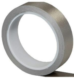
A – YSHIELD GSX10 / GSX50 Grounding strap (25 mm x 10 m / 25 mm x 50 m)