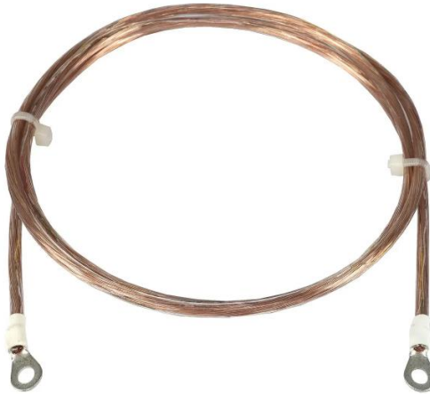
C – YSHIELD GL20 / GL100 / GL200 / GL500/GL1000 Grounding cable